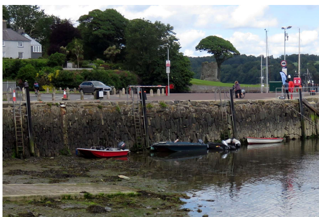
5 mètres de marée, l'amarré de l'annexe est trop courte !