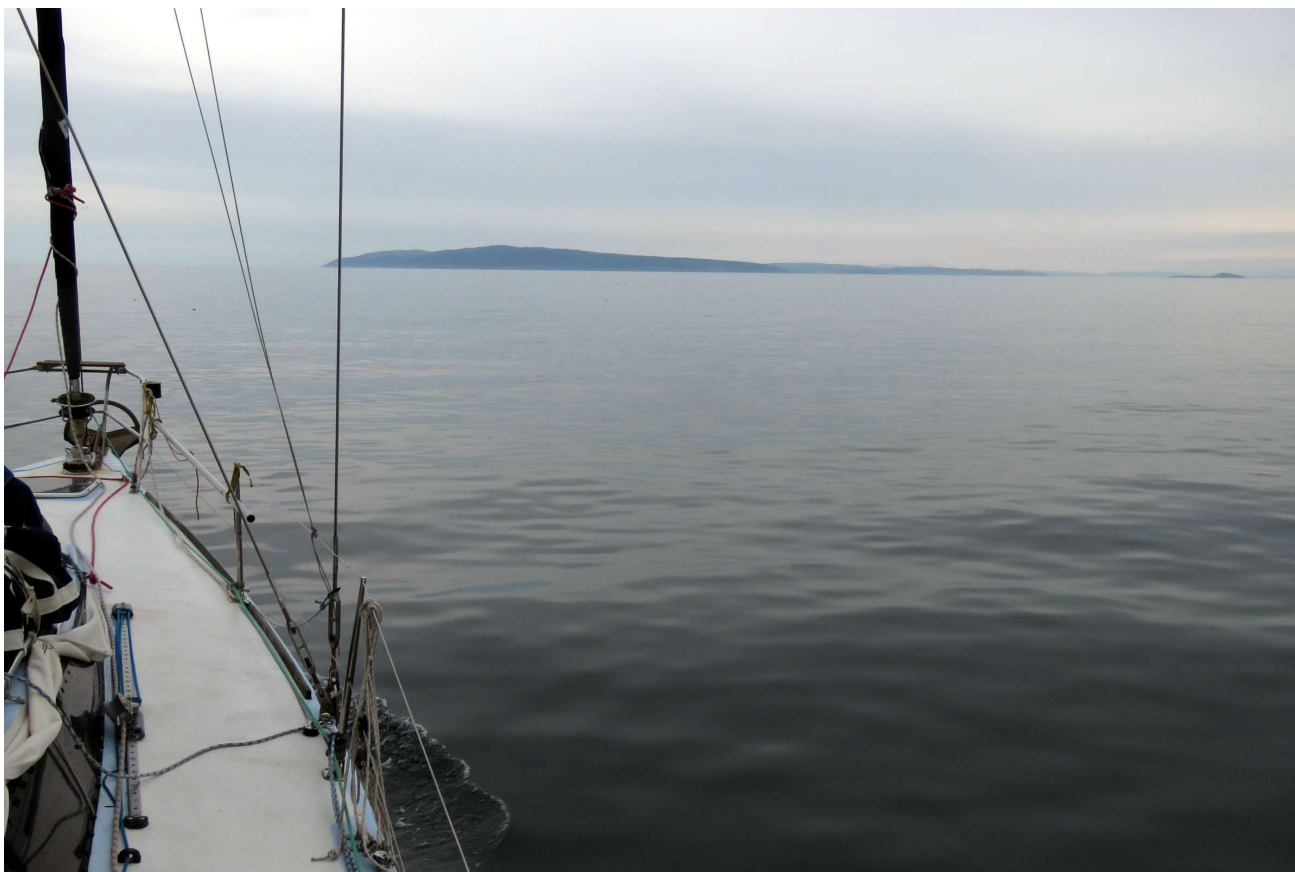
Mull of Kintyre