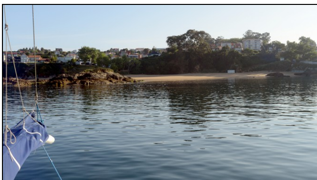
Playa del Portelo

Playa del Portelo (43°22.80'N – 008°20.62'W) Playa de Chanteiro (43°26.83'N – 008°18.35'W)