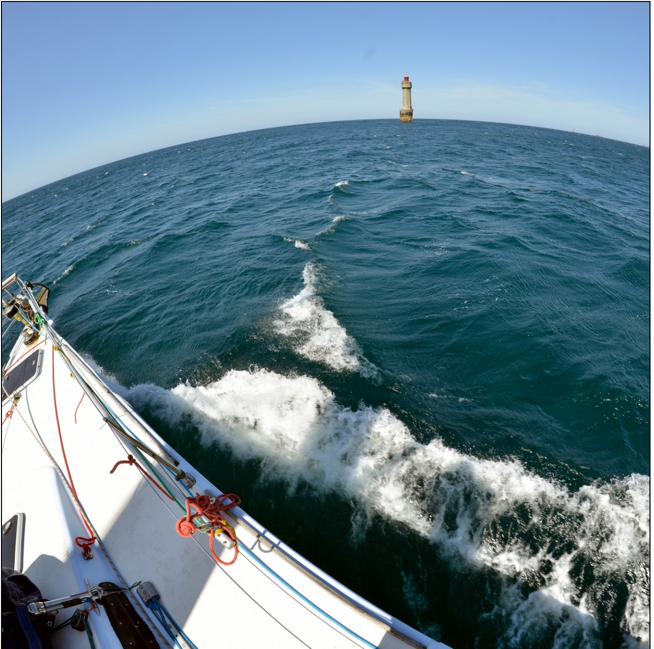
Le phare de la Jument, à l'entrée de la baie de Lampaul où Thoë a passé la nuit