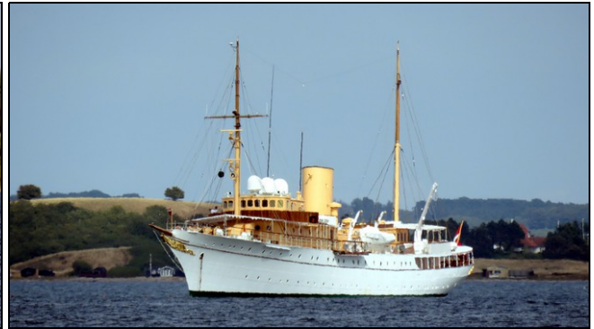
Dannebrog – Yacht Royal (1931, 76 m) https://fr.wikipedia.org/wiki/KDM_Dannebrog