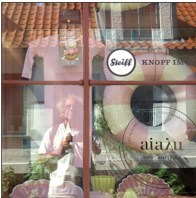
Retour en enfance