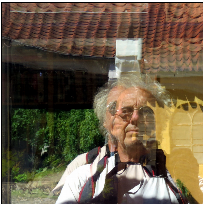
Dédoulement de la personnalité du Cap'