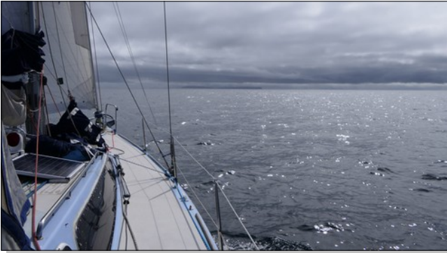
Ciel chargé... Canna approche...

Je ne me souviens pas de la dernière fois quand j'ai pu rester de si longues minutes, vautré sur le sac la trinquette, rangée devant le mât. Pour le coup, ma mémoire ne défaille pas. Ces souvenirs ont simplement dépassé leur date limite de consommation.