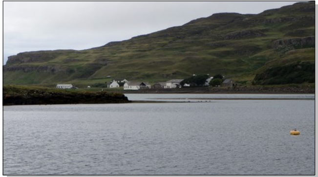
Une dizaine de maisons