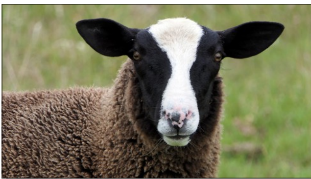
Teint-on les moutons avant de les tondre ?