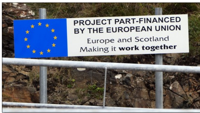
Paroles... paroles... paroles...