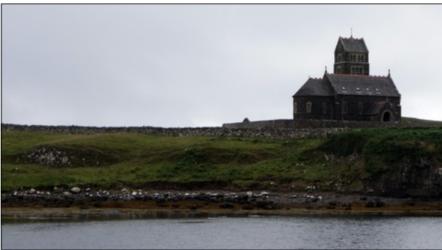
Quelle mouche de dieu a bien pu piquer qui, pour qu'il construise une cathédrale abandonnée dans une île quasi déserte ?