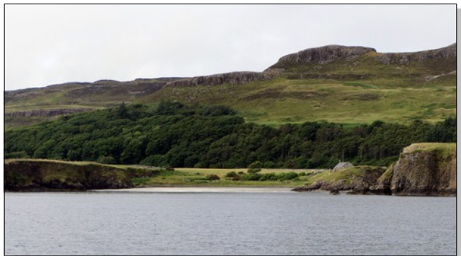
Des arbres qui m'ont manqué !