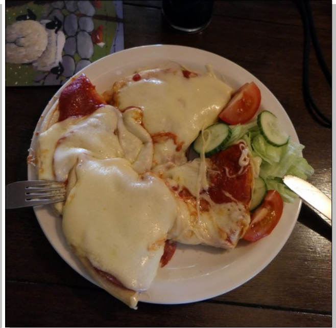
Concentré de tomate + tranche de mozzarella = pizza