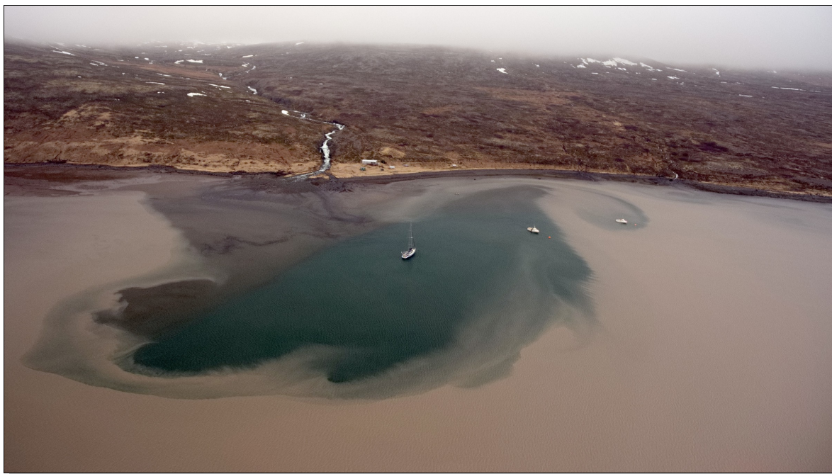
Thoè au mouillage dans l'eau claire du torrent à Leirufjordur.

L'eau brune vient du torrent glaciaire