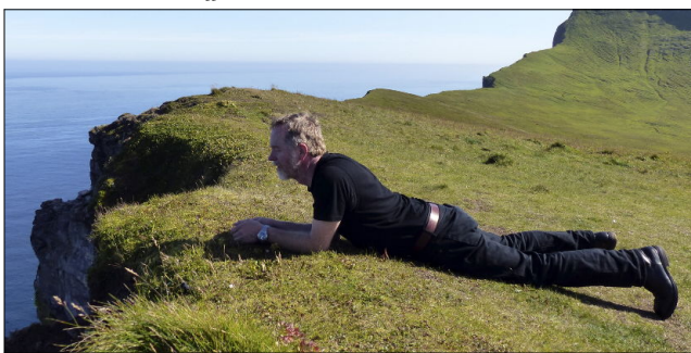
Trop hautes, les falaises ?