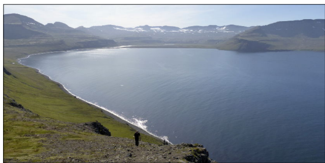
Thoë au mouillage, minuscule point invisible dans l'immensité