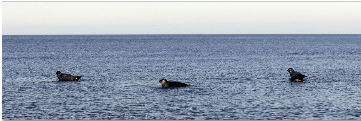
Marée basse, chacun vautré au soleil sur son rocher affleurant