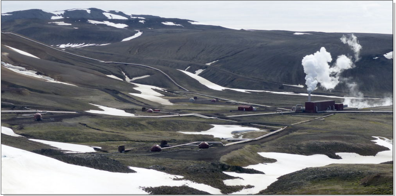
Site géothermique de Krafla – Lunaire !