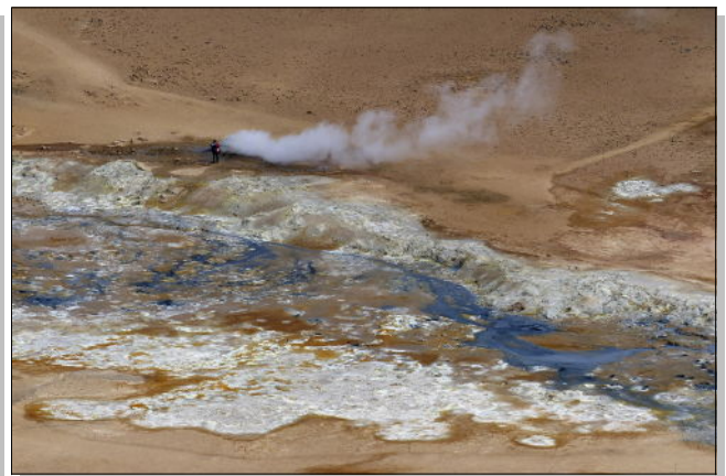
Site de Hverir – chaleur, bouillonnements, vapeurs sulfureuses multicolores