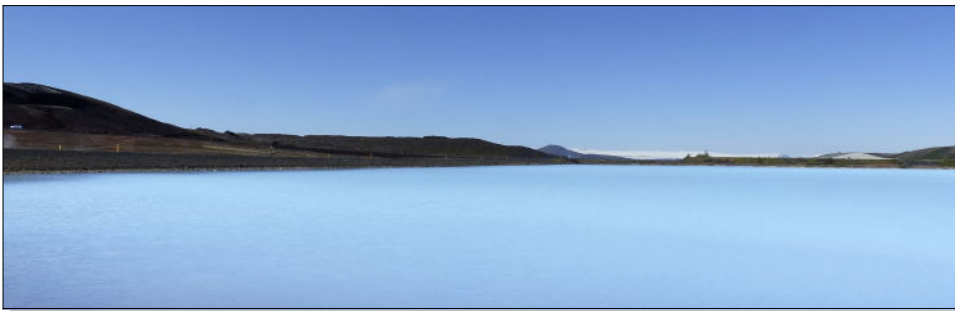
Centrale de Myvatn

On le sait, l'Islande est un des rares lieux où l'on peut voir tous les éléments mélangés. Le feu, la vapeur, l'eau, la neige, la glace cohabitent comme s'ils avaient la même température. C'est là qu'on apprend à regarder plus loin que le bout de son nez. Le bon sens nous dit que feu et eau ne peuvent cohabiter, que l'eau éteint le feu, que la vapeur fait fondre la neige. Ce n'est vrai que pour les simples esprits organisés de façon dichotomique où le blanc ne peut côtoyer le noir, pour qui toute situation est figée dans un immobilisme aussi rassurant qu'imaginaire. En réalité, tout est dynamique, tout bouge, tout évolue constamment, tout se transforme, rien n'est jamais pareil à l'instant T qu'à l'instant T-1. L'équilibre est une vue béate d'un esprit humain avide de l'ennui désespérant d'un monde endormi dans lequel rien ne changerait plus. Un monde où Darwin aurait oublié de naître. Un monde moderne où l'Homo megalus grandiosus pense être capable de recréer la nature (et les dieux) à son image d'humanoïde tout puissant.