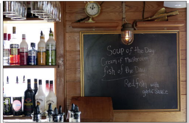
Et un repas bien mérité, entre toutes ces émotions !