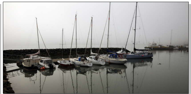
Thoè amarré dans le brouillard, à quelques mètres du centre culturel et d'information touristique d'Akureyri