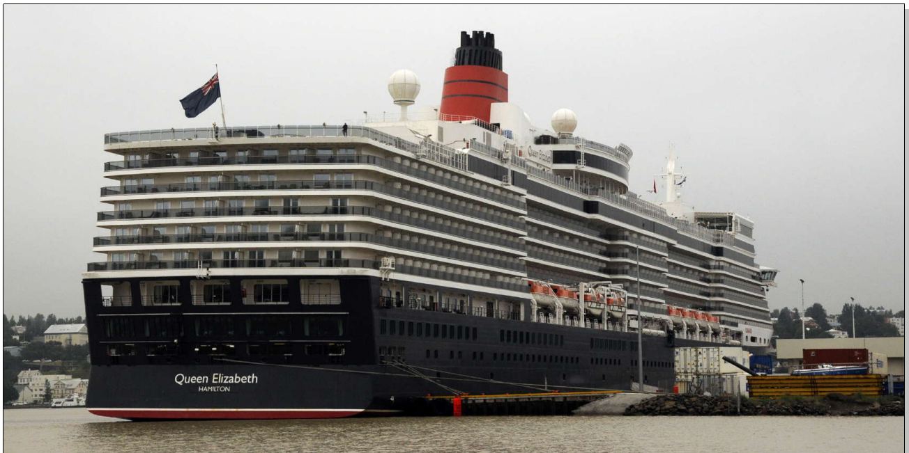
Le Queen Elisabeth ne passe pas inaperçu, malgré le brouillard !