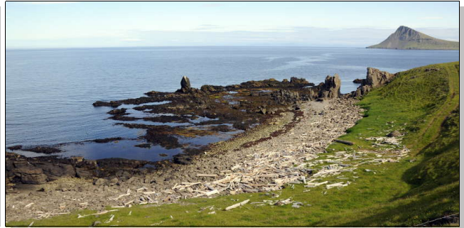
Plage couverte de bois flotté venu de Sibérie